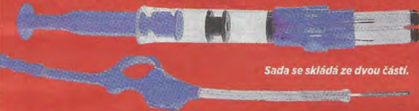
Sada se skládá ze dvou částí.

Svobodovu sadu pro domácí odběr vzorku na Covid-19 už pozitivně hodnotilo ministerstvo zdravotnictví, v těchto dnech ho ze zákona prověřuje Státní zdravotní ústav. Když vše dobře dopadne, možná už v září bychom si mohli ověřit přítomnost viru v těle stejně jednoduše, jako si ženy doma zjišťují těhotenství. Samotný stěr si pacient provede štětičkou, která po odběru zůstane samočinně skryta v trubičce, neohroží tedy okolí a lze ji poslat do laboratoře třeba pošlou. Domácí test navíc nebude drahý, vyjde na 70 až 120 korun.