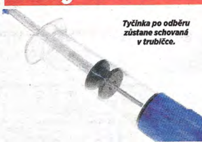
Tyčinka po odběru zůstane schovaná v trubičce.

navirus Svoboda se svým týmem využil svého základního vynálezu, kterým před několika lety potěšil všechny zdravotníky, zvané "trubičky". Jeho nová konstrukce chráněného přístupu - například katetru - totiž omezuje na minimum riziko infekce, neboť se při zavádění postupně obrací naruby a po- vřch, na němž by mohly být viry a bakterie zaneseny tam, kam se dostat nemají, zůstane na místě.